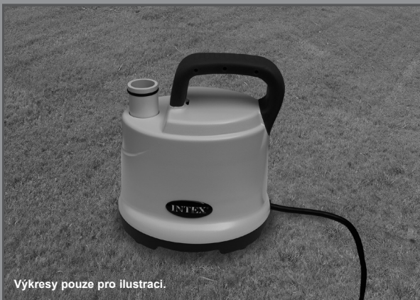
Výkresy pouze pro ilustraci.

Nezapomeňte vyzkoušet i jiné skvělé výrobky Intex: bazény, bazénové příslušenství, nafukovací bazény a domácí hračky, matrace a lodě, které jsou k dispozici u znamenitých prodejců, nebo navštivte naše webové stránky.