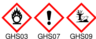
GHS03 GHS07 GHS09